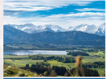
Mitten im Allgäu