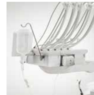
Integrierte Pumpe für Kochsalzlösung