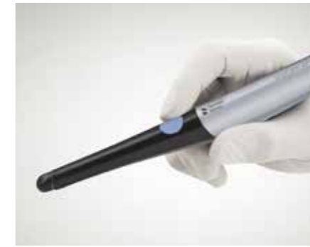
Modernste Ausstattung Die Autofokuskamera SiroCam AF/AF+ verbindet beste Bildqualität mit einfacher Bedienung.