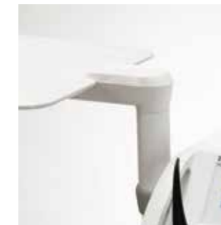
Schwenkbares Tray (bei Sinus TS)