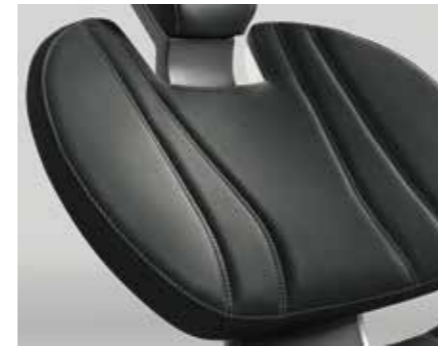
Lounge-Polster Perfekter Liegekomfort durch weiches, angenehmes Oberflächenmaterial und bequeme Füllung. Konturierte Liegefläche für perfekten Halt.

Durch umfassenden Komfort und neueste Multimedia-Technologie für die Beratung sorgen Sie mit Sinius bestens für Ihre Patienten. Besonders bei langen Behandlungen kommt der Patientenkomfort von Sinius zum Tragen. So bleiben Ihre Patienten entspannt und Sie können sich ganz auf die Behandlung konzentrieren. Mit der SiroCam AF/AF+ und dem 22"-Monitor erweitern Sie nicht nur Ihr eigenes Behandlersichtfeld, sondern erleichtern Ihren Patienten auch das Verständnis und die Entscheidung für eine Behandlung.