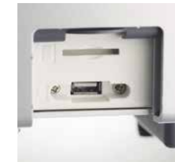
USB-Schnittstelle im Arztelement