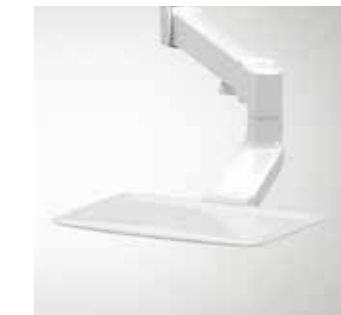
Dentsply Sirona Tray (bei Sinus)