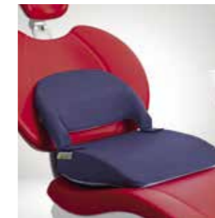
Sitzauflage für kleine Patienten