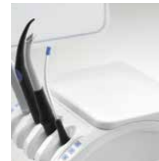
Zusatzablage Assistenzelement (Silikonauflage)