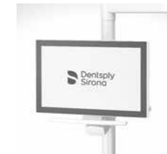
Monitor, 22", an der Leuchtaufbaustange