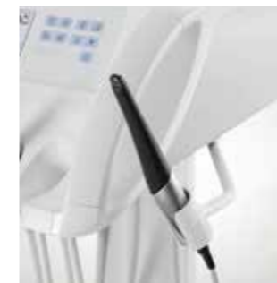
SiroCam AF+ in der Zusatzablage