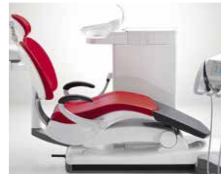
Maximale Absenkung Sinius kann bis auf 36 cm abgesenkt werden, um älteren Patienten und Kindern den Einstieg zu erleichtern.