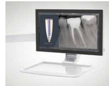
Multimedia-Beratung mit 22"-Monitor Röntgenbilder, Intraoralaufnahmen und Planungsansichten steuern Sie ganz einfach über die EasyTouch-Bedienoberfläche an.