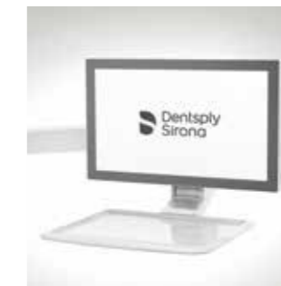
Monitor, 22", am Tray