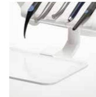
Schwenkbarer Tray-Halter (bei Sinus CS)