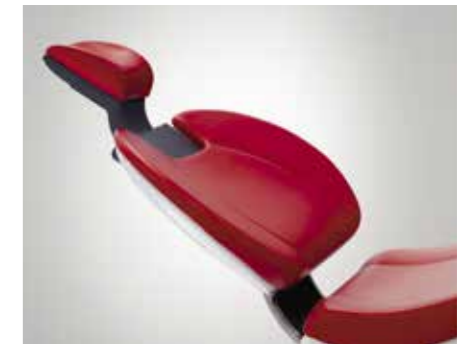
Lordosefunktion Die Rückenlehne kann individuell an die Wirbelsäule jedes einzelnen Patienten angepasst werden.